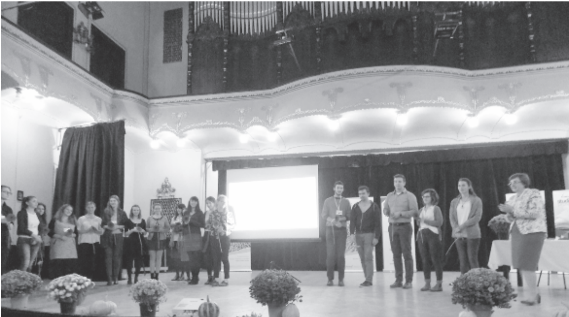
Akiket megillet a taps