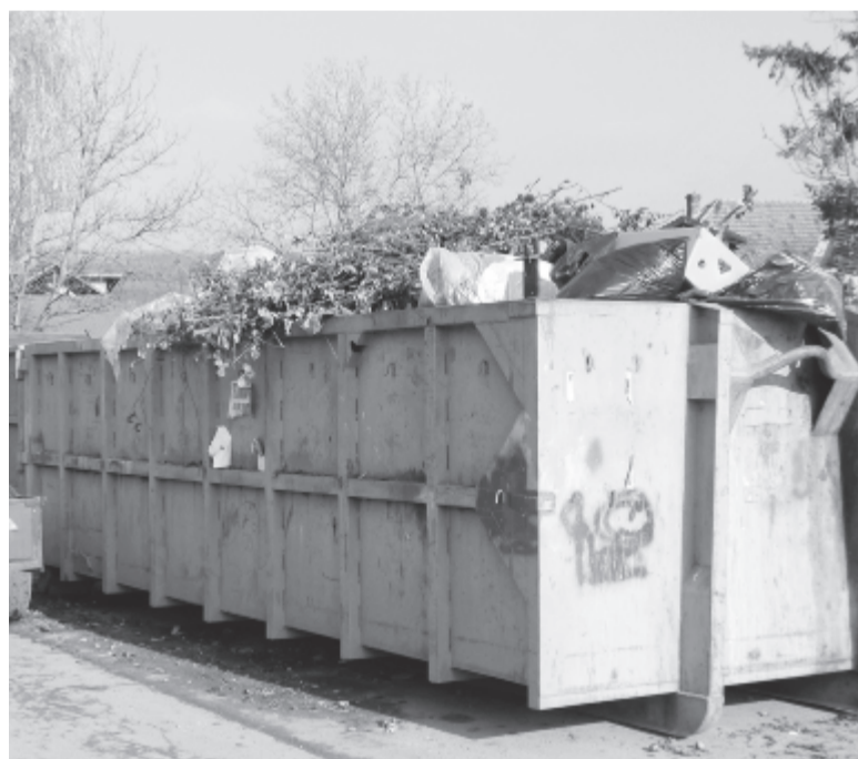
A remélnél jóval több hulladék gyűlt össze