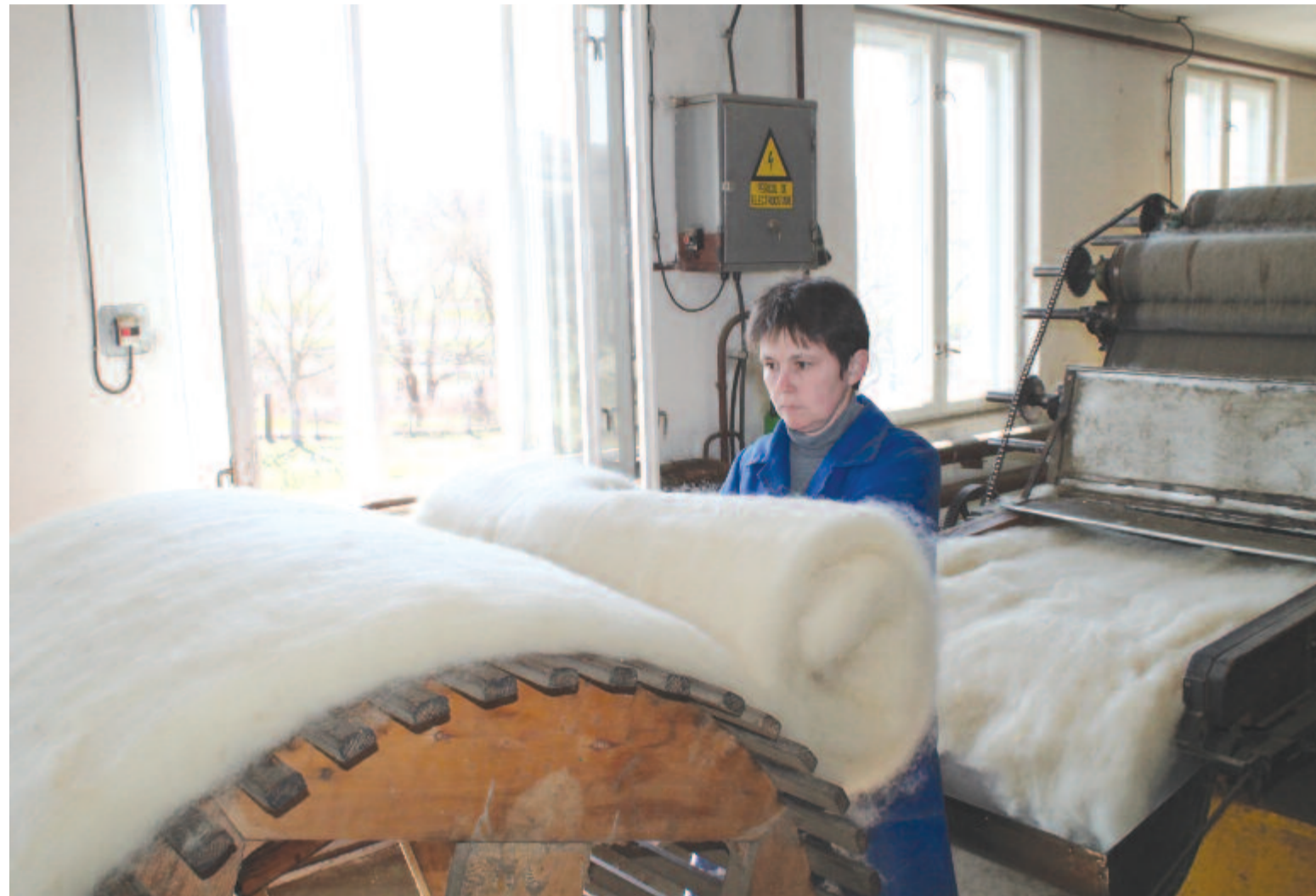
A kibédi Siltexim Kft. gyapjűfőldőző műhelye